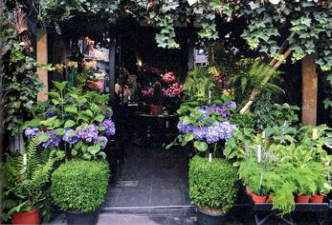
上：床先に置いた大きなプランターから、2、3種のアイビーのツルをはわせて、ファサードをふちどる。左中：壁に囲まれるウィンドウに記されたロゴ。右下：小さなガラス花瓶に、コチョウランを並べて、右下：バラとビバーナムをいけた花瓶の水は、神秘的なブルーに染めて。